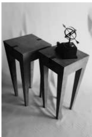
Figura 4. Mesas esquineras en madera diseñadas por Salazar Mujica, R. (2018).

Quien obtuvo el premio Who is Who in Interior Design (1991) y Rosa Salazar Mujica, quien destacó por el diseño de espacios interiores, en los cuales los muebles constituyen elementos enriquecedores y definitorios del espacio, como se observa en la próxima figura.